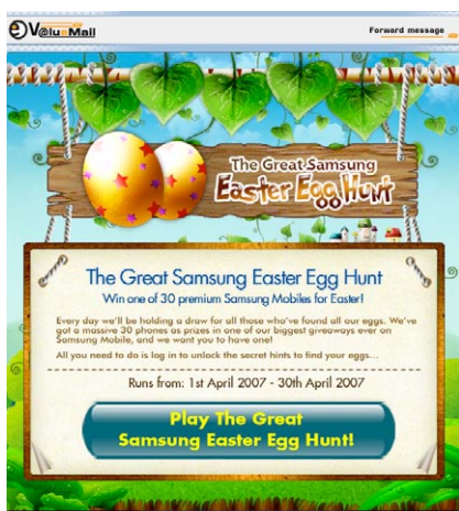
La chasse aux œufs de Pâques