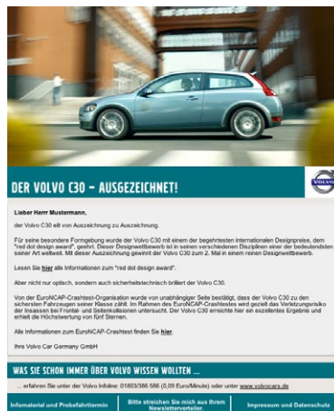
La newsletter speciale per i modelli C30 e C70